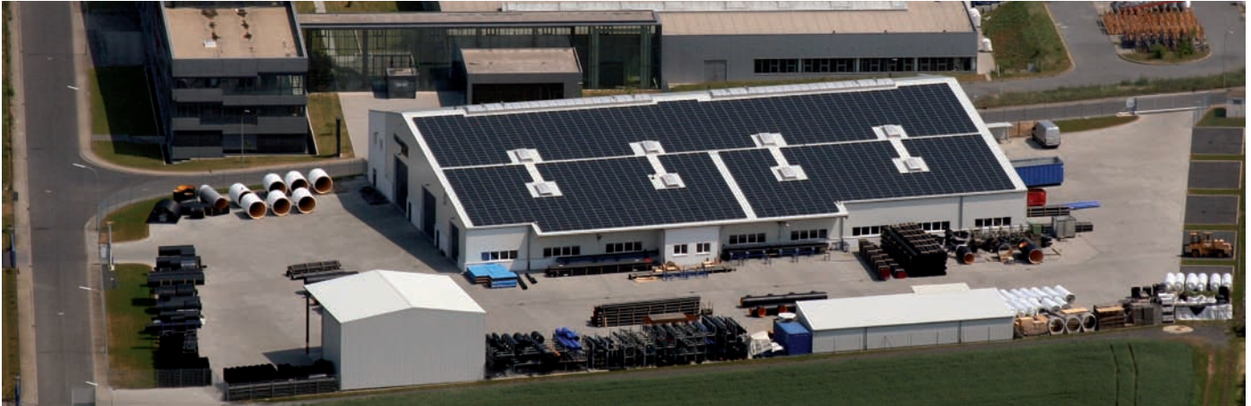
Eines der Firmengebäude der Frank Gruppe im Industrie- und Gewerbegebiet Berstadt

Verantwortung, um das Leben in Hessen heute und in Zukunft ökologisch verträglich, sozial gerecht und wirtschaftlich leistungsfähig zu gestalten.