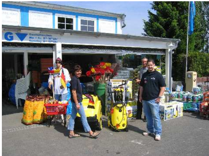
Service aus Tradition - Mitarbeiter des Fachmarktes Isterling